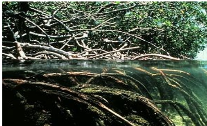
Les mangroves : écosystèmes à haute biodiversité et pouvant contribuer à la lutte contre le réchauffement climatique et contre la pauvreté — Mangroves : High diversity ecosystems that can contribute to the fight against global warming and poverty

Mangroves have attracted the attention of CCLME countries for the identification of a pilot project (GFL-2328-2731-4B73) which