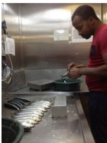
Détermination du stade de maturité

La campagne de prospection acoustique, fruit d'une coopération entre les projets CCLME et EAF-Nansen ainsi que le Sénégal, la Gambie, la Mauritanie et le Maroc, a couvert la région allant de la frontière sud du Sénégal à Larache, dans le nord du Maroc. Elle a été divisée en plusieurs étapes, avec trois rapports de campagne distincts, portant sur le Sénégal et la Gambie, la Mauritanie et le Cap Blanc puis de cette zone au nord du Maroc.