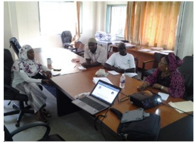
Formation des agents de Tanbi

FR: Test de la méthodologie d'évaluation et de suivi participatifs des AMPs par les acteurs de Cayar (Sénégal) et Tanbi (Gambie) en juillet et novembre 2015