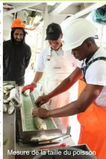
Mesure de la taille du poisson

La FAO et le projet EAF-Nansen ont par le passé soutenu les pays de la région pour les campagnes pélagiques jusqu'en 2006. Après 2006, les institutions nationales de recherche au Sénégal, en Mauritanie, et au Maroc ont pris la relève et ont accepté de réaliser les campagnes avec une couverture synoptique et coordonnée en utilisant les trois navires de recherche nationaux Itaf Deme, Al Awam et Al Amir. Toutefois, pour diverses raisons, cela s'avé-